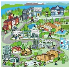
Wonen: leefbaarheid, voorzieningen

Hieronder het overzicht van de thema's waarover we met alle deelnemers van de participatie in gesprek gaan. Deze thema's zijn in de kennismakingsgesprekken met omgevingspartijen geïnventariseerd. Partijen hebben hierbij van te voren kunnen aangeven over welke thema's ze graag willen meepraten en over welke thema's niet. Het overzicht hiervan in te vinden is bijlage 1.