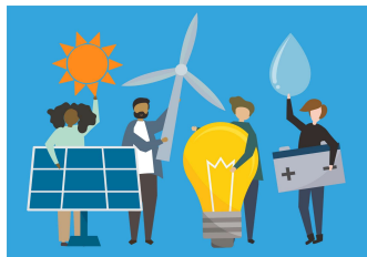
Duurzaamheid: energie, circulariteit