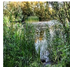
Groen en water: natuur, recreatie, cultuurhistorie